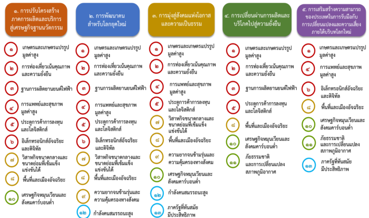
แผนภาพที่ ๓.๑ ความเชื่อมโยงระหว่างหมวดหมู่การพัฒนา กับเป้าหมายหลัก

ความเชื่อมโยงระหว่างหมวดหมู่การพัฒนา กับเป้าหมายหลักแสดงไว้ในแผนภาพที่ ๓.๑ โดยหมวดหมู่ การพัฒนาที่กำหนดขึ้นเป็นประเด็นที่มีลักษณะเชิงบูรณาการที่ครอบคลุมการพัฒนาตั้งแต่ในระดับต้นน้ำจนถึง ปลายน้ำ และสามารถนำไปสู่ผลพัฒนาทั้งในมิติเศรษฐกิจ สังคม ทรัพยากรธรรมชาติและสิ่งแวดล้อมไปพร้อมๆ กัน ทำให้หมวดหมู่แต่ละประการสามารถสนับสนุนเป้าหมายหลักได้มากกว่าหนึ่งข้อ นอกจากนี้การพัฒนาภายใต้แต่ละ หมวดหมู่ไม่ได้แยกขาดจากกัน แต่มีการสนับสนุนหรือเอื้อประโยชน์ซึ่งกันและกัน